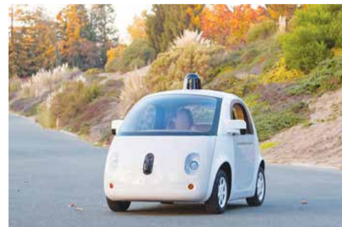
Так выглядит беспилотник Google, представленный в конце 2014 года. Машина, по словам создателей, готова выехать на дороги города. Но, в отличие от «КАМАЗа», в Google не намерены заниматься производством автомобиля: компания ищет партнёров, которые хотят продвигать разработанные фирмой технологии

— Машину надо будет обучать поведению в разных дорожных ситуациях. Количество дорожных сценариев исчисляется десятками тысяч или даже больше. Машина должна уметь в каждой ситуации находить решение, распознавать объекты: столб, дерево, человек, край дороги и прочее; отслеживать движение нескольких объектов в режиме реального времени, принимать решение и корректировать свою траекторию движения. А ввиду того, что планируемая скорость авторобота — стандартные 80-90 км/ч, то скорость принятия решения должна быть стремитель-