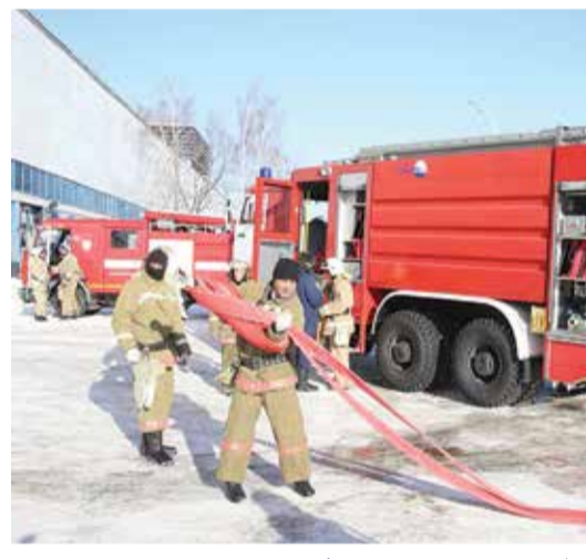
Уникальная машина вмещает 7,5 тонны воды и полтонны пенообразователя

Из склада автомобильного завода валят белые клубы: убедительную картину пожара создают дымовая шапка и театральный дым. Через 15 минут прибывают пожарные расчёты и разворачивают срочные операции. Ещё через пять минут пожарные начали охлаждение несущих конструкций, защиту кровли и перекрытий. От момента сообщения о пожаре до его ликвидации прошло 25 минут. На тушении пожара продемонстрировали возможно-