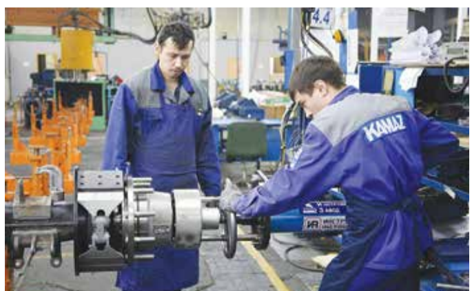
Четыре новых агрегата работают в цехе мостов Ав3

жданный аппарат со сложным названием «пневматический многошпиндельный