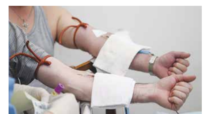
В зависимости от состояния здоровья каждый донор сдал от 380 до 420 граммов крови