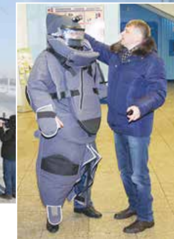
К учениям привлекли сапёра в противовзрывном костюме, который извлёк муляж взрывного устройства в фойе АБК ПРЗ

рый позволяет тушить возгорания на электроустановках до 10 киловольт», — говорят о технике специалисты. Всего в операции участвовали семь пожарных и спасательных машин. Это лишь один из