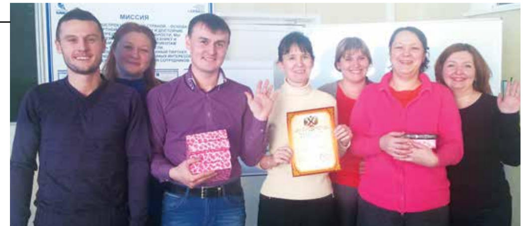
Команда «ПБО», набравшая максимальную сумму очков

этом первый настроен к окружающим дружелюбно, хотя некая женщина от него немало пострадала. Второй же, наоборот, весьма недружелюбен, но некой женщине удалось в итоге избежать угрозы с его стороны. Интересно, что оба давали одинаковые обещания. Кто же они?» Давы камазовцы в приближающийся праздник не ломали головы, правильный ответ: «Карлсон и Терминатор»: первый — улетел, но обещал вернуться, второй произнёс крылатую фразу «I'll be back». Грамоты и сладкие призы