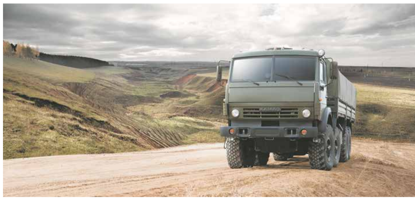
Машины с системой RoboPilot, работающие без водителя, заинтересуют, в первую очередь, силовые ведомства

условиях, менее 0,1 секунды, ведь за доли секунды машина проезжает десятки метров. Это означает, что мощность вычислительной техники, установленной в автомобиле,