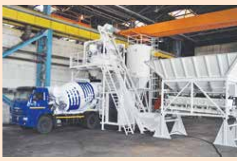
Бетонные заводы сочетают в себе характеристики как стационарных, так и мобильных установок

Ключевыми особенностями бетонных заводов марки «ТЗА/КБЗ» является их компактность, в связи с чем транспортировка оборудования осуществляется двумя фурами. Монтаж и демонтаж можно выполнить в сжатые сроки, а поскольку необходимости в подготовке специального фундамента нет, затраты на его заливку под установку завода минимальны.